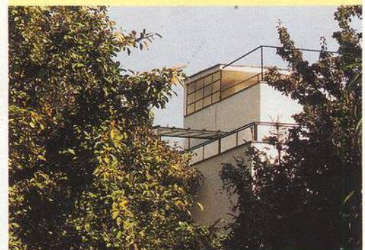
JINÉ ČTENÍ - BABA