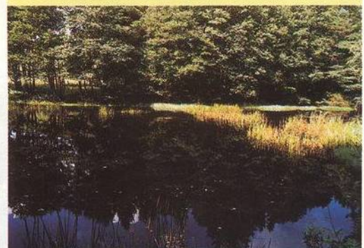
VODOU PROTI VODĚ