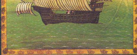
Repro z knihy Follow the Dream