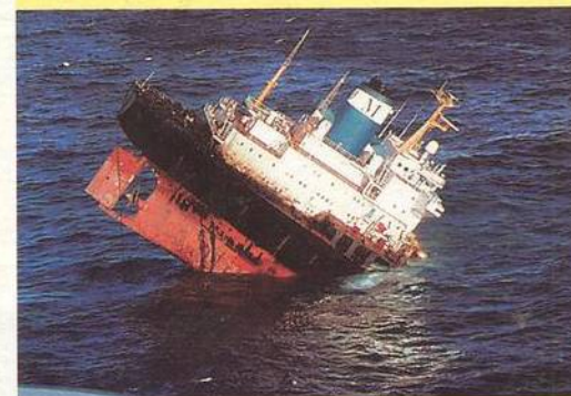
POZORUHODNÝ SVĚT TANKERŮ