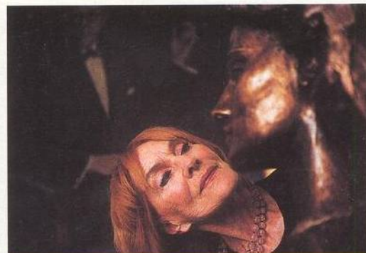
DÁMA V ČERVENÉM