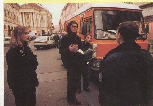
PROČ SE TO V PRAZE NEPOPRALO?