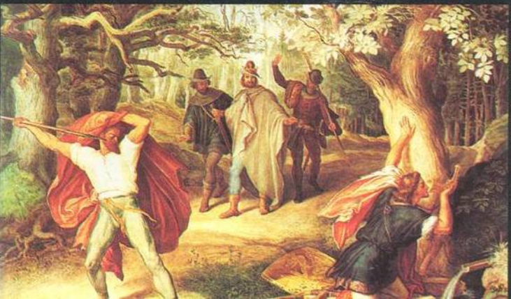
Repro z knihy Nibelungen

60 Renesance Písňe o Nibelunzích, znovuobjeveného staroger-mánského eposu, došla v průběhu několika desítek let tak daleko, že v 19. a první polovině 20. století byla pochopena jako příběh Němců a propagandou mnohokrát zneužita.