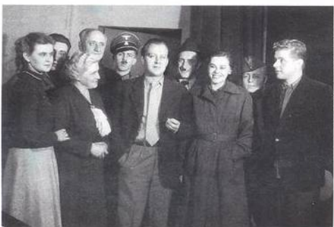
Karel Höger hrával i s ochotníky