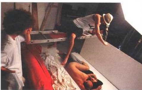
Focení na titul Reflexu

Zdravím, dnešní foto na titulní straně s JXD je mnohem lepší než originál. Úsměv mi vydržel plnou hodinu (od nákupu RX až do práce).