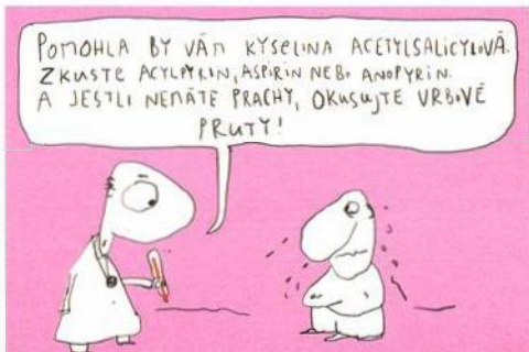
KRESBA MAREK DOUŠA

PŘEDPLATNÉ objednávejte telefonicky na čísle 541 233 232 nebo na adrese www.predplatne.reflex.cz Remitendní výtisky a DVD ze série X krát divadlo jsou v prodeji v trafice NICOTIANA TABACUM, Senovážná ulice 2, Praha 1