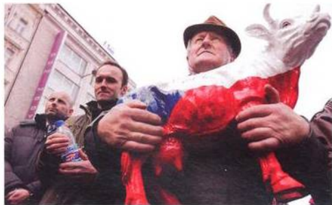
Zemědělci demonstrovali 12. března v Praze

Vážený pane Havle, nevím, v jaké zemi žijete Vy, ale v zemi, ve které žiji já, si zemědělci nemohou dovolit vlastnit traktory s GPS, a navíc bez traktoristů, tudíž Vaše kázání je jaksi neopodstatněné. Na jednu stranu je tato věta velice úsměvná a vylepší odpolední siestu u kávy. Na druhou