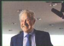
GEORGE SOROS ZAKLADATEL & PŘEDSEDA OPEN SOCIETY INSTITUTE / SOROSOVY NADACE