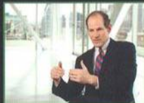
ELIOT SPITZER BÝVALÝ GUVERNÉR STÁTU NEW YORK A STÁTNÍ ŽALOBCE STÁTU NEW YORK