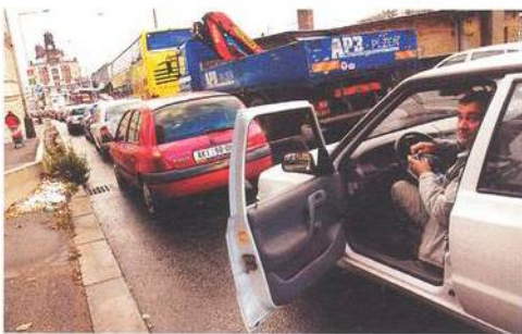
Kdo v Praze „zvítězí“? Auta, cyklisté, nebo chodci?

Remitendní výtisky a DVD ze série X krát divadlo jsou v prodeji v trafice NICOTIANA TABACUM, Senovážná ulice 2, Praha 1