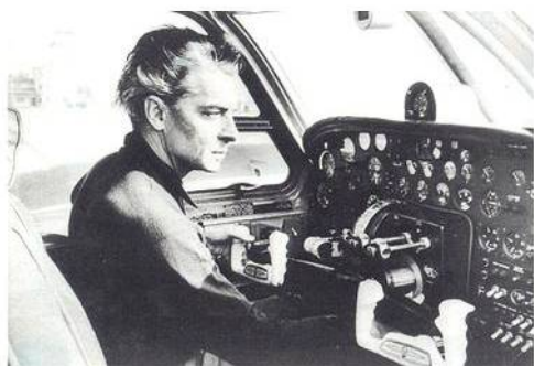
Herbert von Karajan v kokpitu letadla

c) K původu Svjatoslava Richtera a Davida Oistracha bych dodal: první z nich se narodil v roce 1915 v Žitomiru v carském Rusku (dnes Ukrajina) ruské matce a německému otci. Druhý