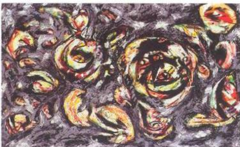
Jackson Pollock trpěl depresemi, depresivní jsou i jeho obrazy