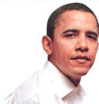
NA TITULNÍ STRANĚ KANDIDÁT NA AMERICKÉHO PREZIDENTA BARACK OBAMA