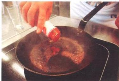
Pekelná příprava omáčky