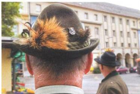
Rakušané zezadu ...