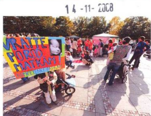
Demonstrace se konala začátkem října před ministerstvem zdravotnictví

„Za posledních patnáct let se péče o těhotné ženy výrazně zhoršila,“ cituje paní redaktorka. Ano, to je pravda. Před patnácti lety byla ženám po porodu poskytována péče v porodnici po dobu šesti až sedmi dní a poté ji zcela samozřejmě navštívila nejméně jednou, ale spíše