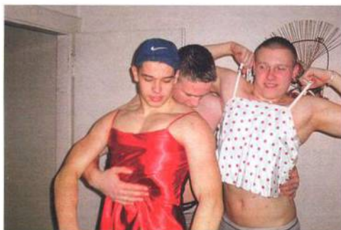
Sluší nám to?