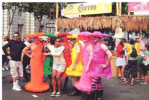
Gay Pride v San Francisku

Remitendní výtisky Reflexu od čísla 37-05 a DVD ze série X krát divadlo jsou v prodeji v trafice NICOTIANA TABACUM, Senovážná ulice 2, Praha 1