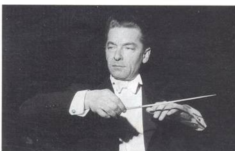
Herbert von Karajan, čaroděj taktovky i morálky