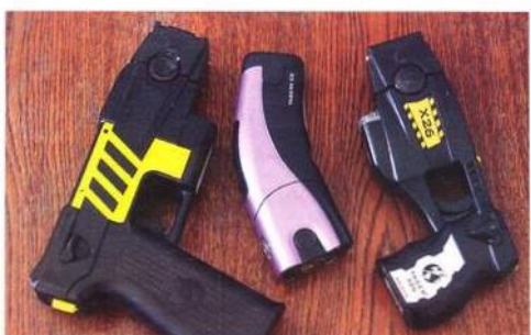
Různé typy taserů

Argumentace, že po zásahu taserem zemřelo tolik a tolik lidí, je zcestná. Kolik lidí bylo ubito obuškem či zastřeleno? A proč neustále argumentujeme americkými statistikami? My nejsme v USA, kde může držet zbraň kdekdo. Jsme v Česku, a když někdo dělá bordel, měl by se „umravnit“. A raději taserem, než kulkou do jeho přítelkyně, jak se před časem stalo.