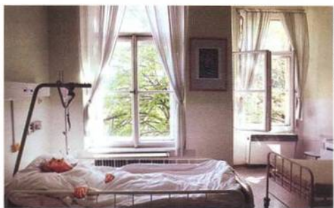
Mnozí z nás se podobnému osudu nevyhnu