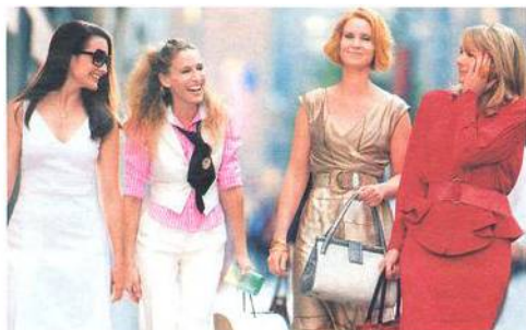
Charlotte, Carrie, Miranda a Samantha

rující rozvoj mužů a mužské identity. Je to organizace vstřícná rovným příležitostem žen a mužů – taková mužská verze ženských genderových organizací ... Je-li LOM otevřen dialogu se ženami i ženskými organizacemi, neznamená to, že přebírá jejich názory.