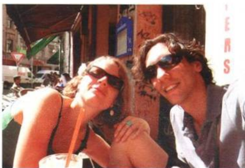
V Berlíně podle Jaroslava Rudiše

Perfektně jsme využili Vašeho letního průvodce Berlínem, sepsaného Jaroslavem Rudišem. Koupili jsme si i drahý, na křídovém papíře tištěný, ale byl hodně těžký, a hlavně spíš než turisty se cítíme čtenáři Reflexu. Spisovatel přesně trefil to, na co jsme se do města těšili a co jsme tam