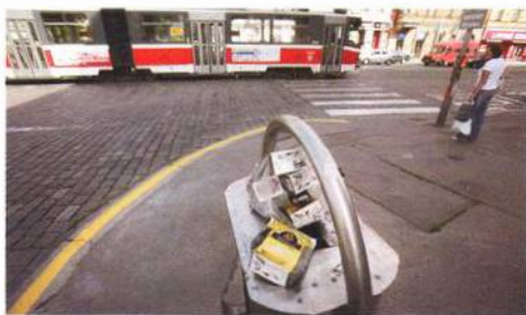
Kam s vajgly?

Vrátila jsem se z výletu do Irsku. Pokuta za procházku s lahvičkou činí 1000 liber, pokuta za kouření mimo „zóny“ se pohybuje mezi 500-1000