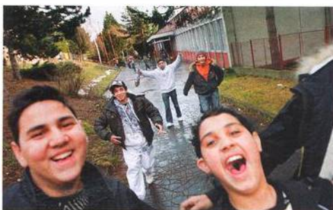
Kluci z Janova