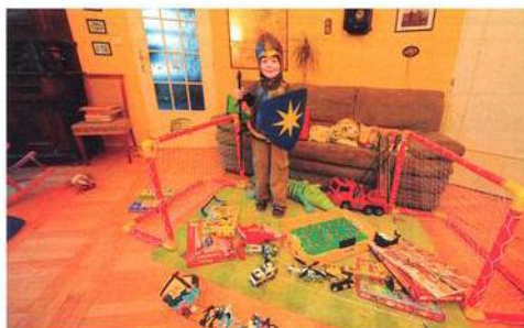
U Tesařů ...