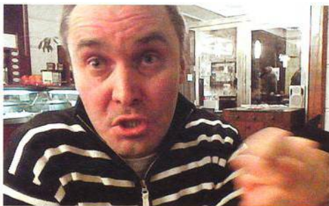
Stalker Míra Pech

Tleskám a nesmírně si vážím pana J. X. Doležala za článek o stalkingu. Slečně, o které je řeč, musí být z její situace hodně zle a pan redaktor vzal na pomoc veřejné mínění. Naprosto s ním souhlasím. Slečně držím palce a doufám, že o skut-