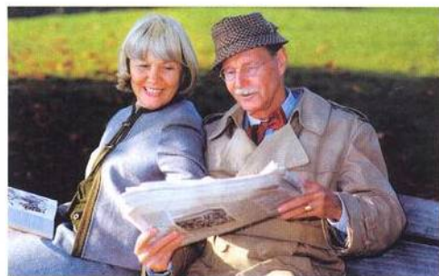
Jak se budou mít důchodci za třicet let?

Problém vznikl jinak: stát zpronevěřil občanům jejich úspory na stáří. Daně byly předtím investovány do státních firem, z jejichž výnosu