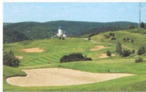
46 České luhy, háje a grúny Jako má každé české okresní město zimní stadión, bude mít brzy i golfové hřiště