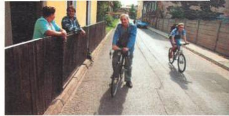
38 Jsou Cikáni normální? Integrace Romů je v městečkách, jako Broumov, obzvlášť obtížná