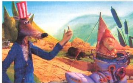
82 Animujte, prosím! Animovaný film jako soukromý byznys u nás příliš nevzkvétá, ale zatím se drží