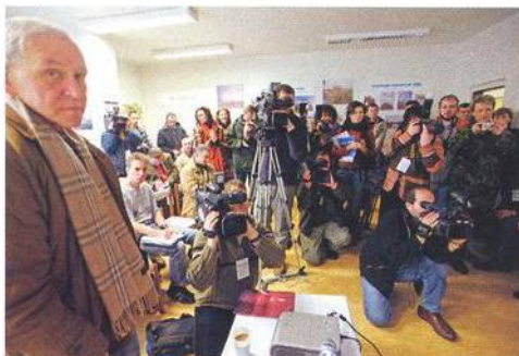
Radar působí jako magnet. Tiskové konference nezejí prázdnotou.

Pane Halado, nedělejte z nás hlupáky a nevsugerovávajíte čtenářům lhostejnost k tomuto problému. Rozdíl je samozřejmě v tom, jakému velení tento systém podléhá. Do systému USA nemá ČR přístup, do systému NATO ano. To je ten podstatný rozdíl. Až budou národní systémy (a USA především) zabudovány do systému NATO, může být na území ČR instalována součást protiraketové obrany NATO ve stejné kvalitě.