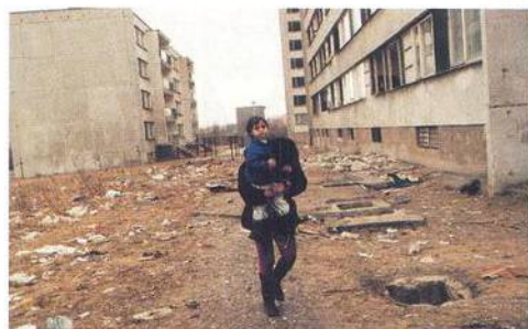
Rom, nebo sociálně vyloučený etnický minoritník?