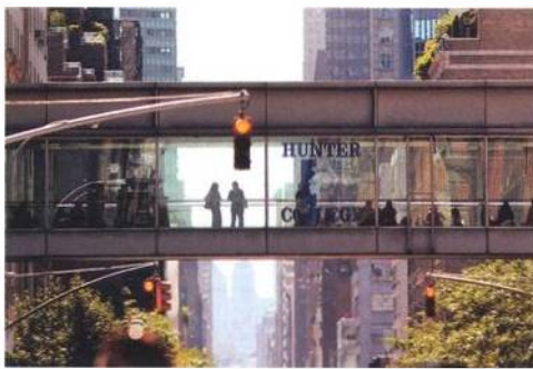
Jedna z lávek na Lexington Avenue v New Yorku

Vaše (Ondřeje Formánka – pozn. red.) A propos o lávkách mi připomnělo nedávnou cestu po Malajsi. Pro velkoměstskou lávku mezi budovami, nebo lépe most mají v Kuala Lumpur ještě jiný anglický výraz, sky bridge. Ve výšce 41. a 42. patra spojuje momentálně nejvyšší dvojici mrakodrapů na světě, známé Petronas Towers. Sky bridge je na věžích jediným demokratickým prostorem, který je přístupný všem, a to dokonce zdarma (za podmínky, že si návštěvník vystojí demokratickou frontu a vejde se do denní kvóty 1000 lidí). Mimochodem, větší část ma-