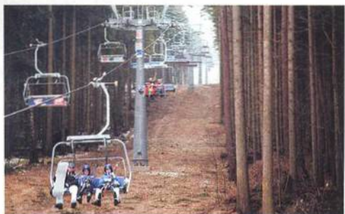
Stromy lanovkám i sjezdovkám překážejí

ONDŘEJ PACLT TISKOVÝ MLUVČÍ SPOLEČNOSTI SYNER