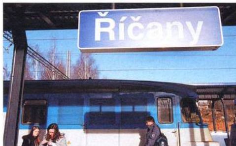
Jak dopadne v Říčanech spor o podobu města?