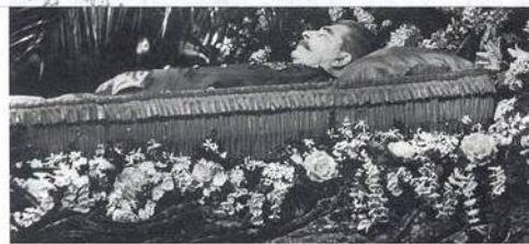
Stalinovou smrtí skončila jedna epocha

valy Lidové milice, celou scénu podmalovával Pochod padlých revolucionářů. Jaké bylo mé překvapení, když jsem listoval ve starých novinách a našel (po úmrtí TGM) fotografii ze Zlína. Před Velkým kinem prakticky identická tržna s velkou fotografií TGM, snad o nějaký kus větší, přece však bylo něco jiné, místo Lidových milic stáli na stráží sokolové a legionáři. Jinak bylo vše stejné včetně plačících davů. Je zajímavé, jak někdy historie má své dějů vu.