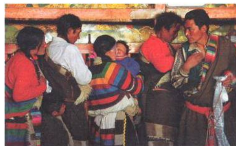
Kláster Džokang uprostřed Lhasy