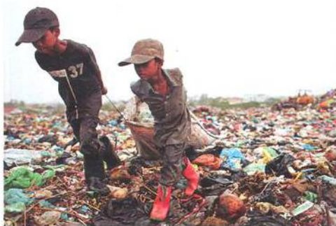
Jedna z oceněných fotografií