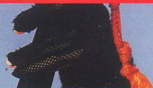
NA TITULU ZPĚVAČKA JANA URIEL KRATOCHVÍLOVÁ. FOTO DAVID KRAUS