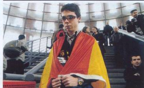
34 NE VRAH, ZAVRAŽDĚNÝ JE VINEN Teror definitivně vstoupil do Evropy. Postiženou zemí je Španělsko.