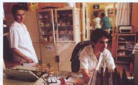
24 NEMOCNICE NA KRAJÍCH SVĚTA Německá, či česká zdravotní péče? Kde je na tom pacient lépe?