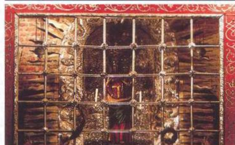
68 LORETA Slavný barokní kostel a poutní areál se před dvaceti lety staly intelektuální oázou.