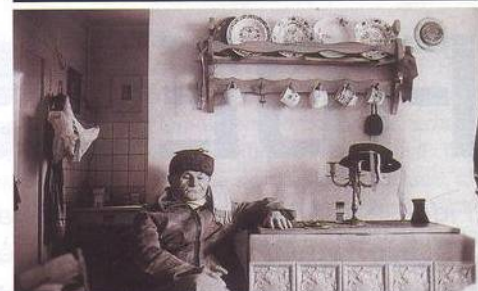
36 Hrabaliana Před devadesáti lety se narodil Bohumil Hrabal