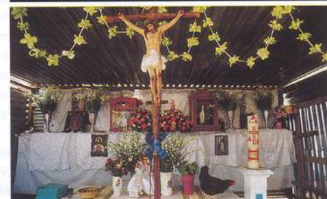
76 Poloprázdné ruce zapatistů Bída a víra jsou dominantami mexického státu Chiapas