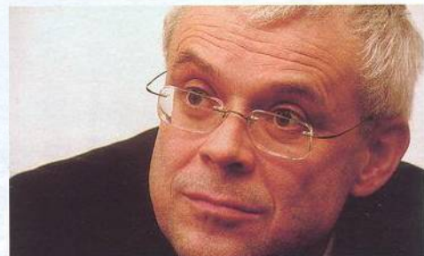
20 Byl to epochální výkon Premiér Vladimír Špidla hodnotí práci svého kabinetu