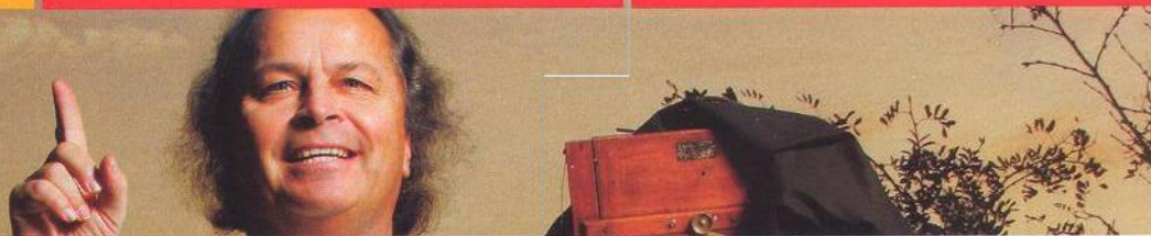
NA TITULNÍ STRANĚ HOUSLISTA VÁCLAV HUDEČEK.