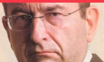
NA TITULU PSYCHIATR PROFESOR CYRIL HÖSCHL.