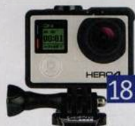
18 Odolné kamery nejen na sport