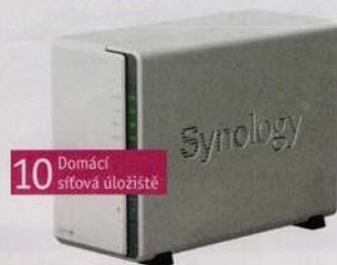
10 Domácí síťová úložiště