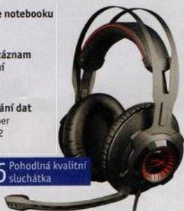
16 Pohodlná kvalitní sluchátka

48 Křížovka Pětí výhercům věnujeme 32GB USB flash disk.