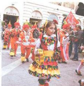
KARNEVALOVÝ PRŮVOD, VALLETTA STR. 18