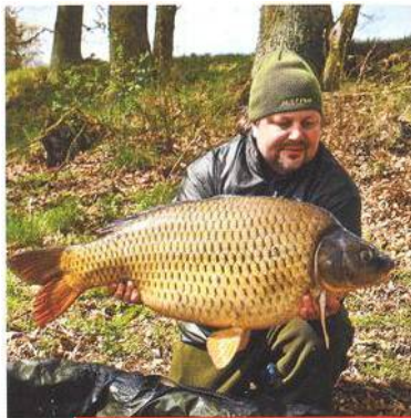
14 Rychlé chytání – jarní taktiky