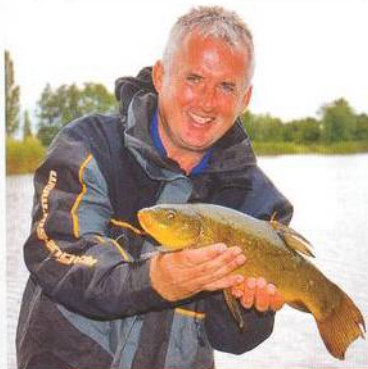
22 Easy Method – feeder pro každého