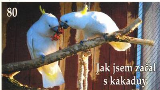
Jak jsem začal s kakaduy