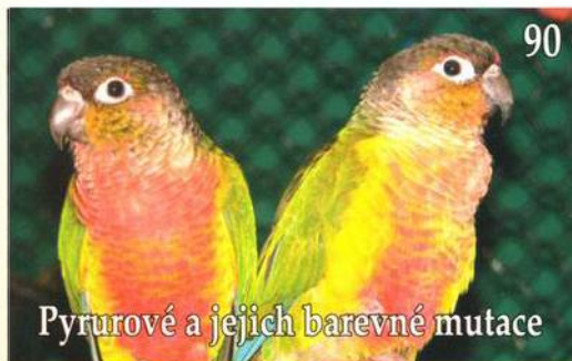
Pyrurové a jejich barevné mutace