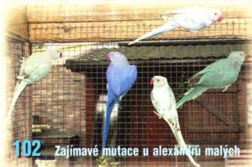
102 Zajímavé mutace u alexandřů malých