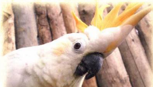
82 O chovu kakaduů sumbských