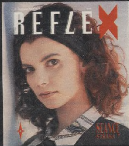
Foto na obálce Patrick Aventurier. Francie (Gamma): Thajský box (detail). WPP '91. 1. cena, sport serie. Lucii Gibodovou fotografovala pro titul příštího čísla Blanka Chocholová. Podrobnosti v článku SUPER-MODELOVÁNÍ.