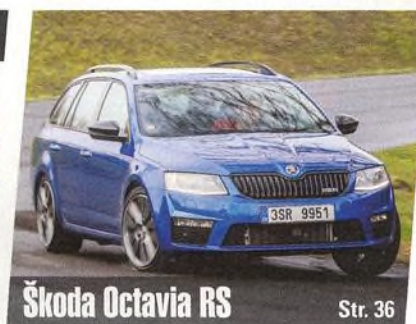
Škoda Octavia RS