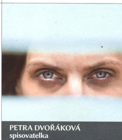
PETRA DVOŘÁKOVÁ spisovatelka

„Vždycky, když jsem vylezl na hřiště, moc jsem chtěl hrát. A chtěl jsem lidi pobavit, překvapit. Dát gól, aby si o něm vyprávěli v hospodě celý týden.“