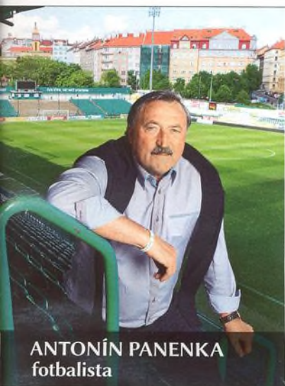
ANTONÍN PANENKA fotbalista

„Musím myslet na to, že si právě nemohu koupit kabát, protože za měsíc budu ty peníze potřebovat na zaplacení zdravotního pojištění.“