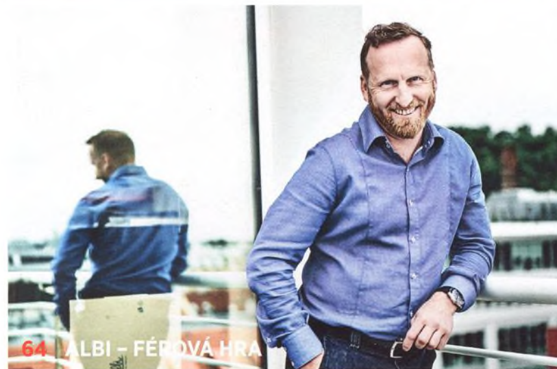
64 | ALBI – FÉROVÁ HRA