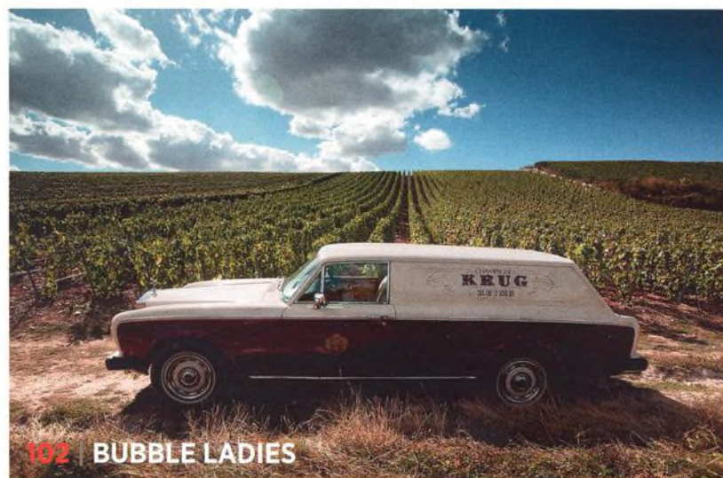
102 | BUBBLE LADIES