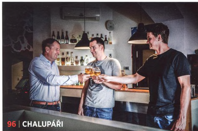
96 | CHALUPÁŘI