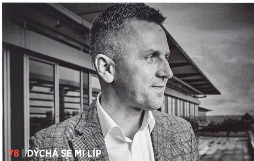
78 | DÝCHÁ SE MI LÍP