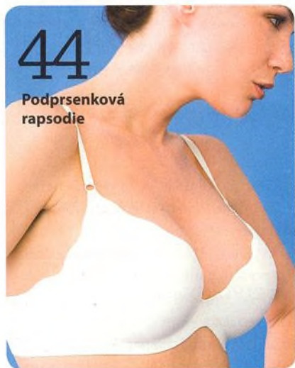
44 Podprsenková rapsodie