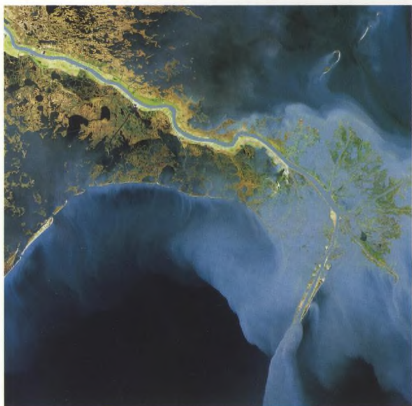
Delta Mississippi v Mexickém zálivu