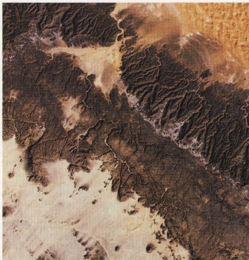
Alžírsko: Rozeklané Tassili na Saahaře