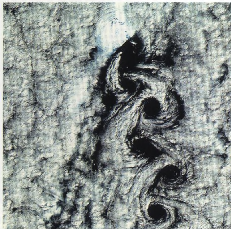
Obláčný vír nad ostrovem Jan Mayen v severním Atlantiku