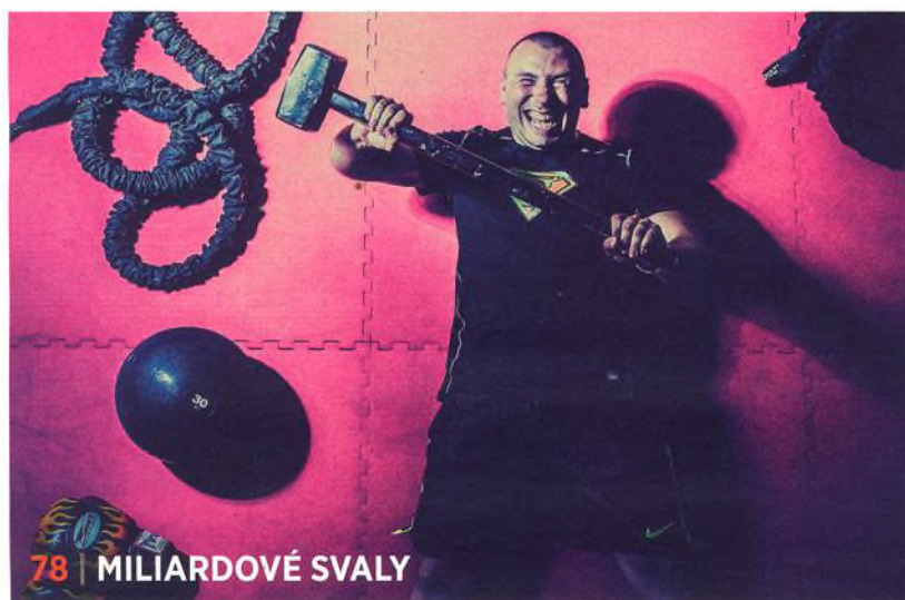
78 | MILIARDOVÉ SVALY