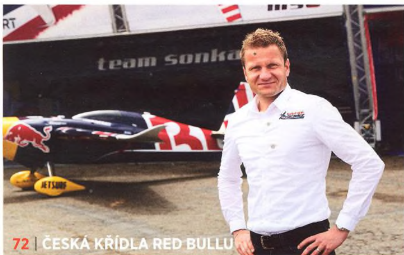
72 | ČESKÁ KŘÍDLA RED BULLU