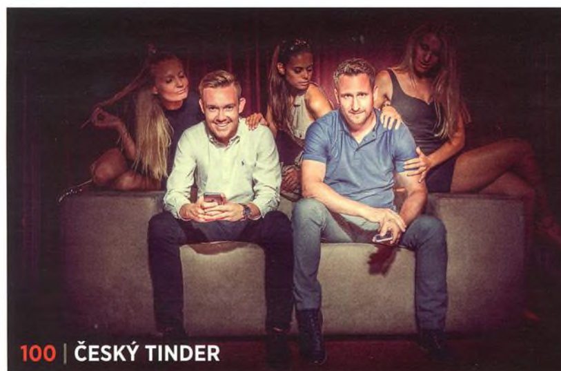
100 | ČESKÝ TINDER