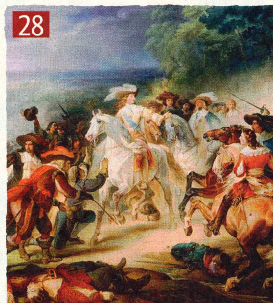
♠ Vévoda Enguien zastavuje své muže v bitvě u Rocroi před útokem na vzdávající se španělské vojáky