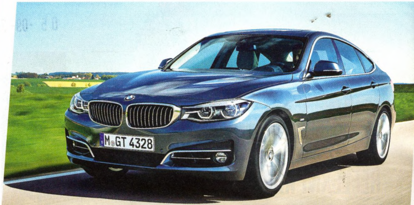
BMW 3 GT

V tipech na výlet muzeum na jižní Moravě..... 73