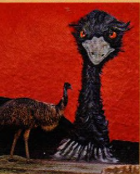
Titul: Emu hnědý – živý i namalovaný, snímek z bioparku Téplice od L. Nekolného, str. 1