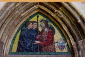
Klášter v Emauzích, str. 14