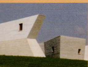
Archeopark Pavlov, str. 27