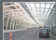
Profiluková stěna - II. etapa, Hradec Králové