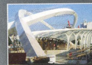
Stanice metra Strážkov, Praha