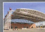
Hangár, letiště Ostrava - Mošnov