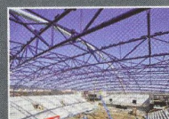
Zimní stadion, Chomutov