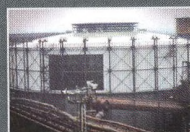
Rekonverze plynojemu, Ostrava - Vítkovice